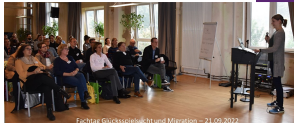
Fachtag Glücksspielsucht und Migration – 21.09.2022