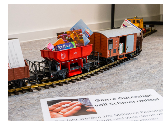
» Einweihungsfeier des Forums Kirche und Diakonie im Juni 2022